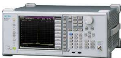
標準価格：約543万円～(26.5 GHzモデル)

C帯/X帯 一次レーダ等の送信特性評価や、5/6 GHz帯 無線LANのスプリアス評価など