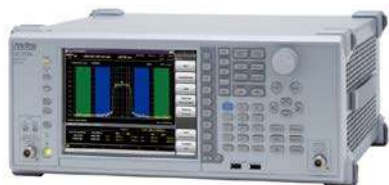
標準価格：約199万円～(3.6 GHzモデル)

デジタル&アナログの業務無線の送信&受信の特性評価に！(電波法・登録点検、受信感度など) スペクトラムアナライザ・パワーセンサ・周波数カウンタ・信号発生器・BER機能・オーディオアナライザ/ジェネレータ を1台に搭載。さらに自動測定で負荷軽減&時間短縮。