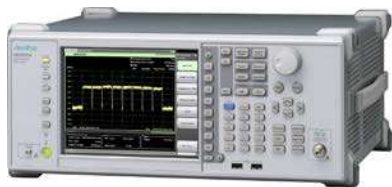
標準価格： 約1,430万円～(32.0 GHzモデル) 約1,715万円～(44.5 GHzモデル)